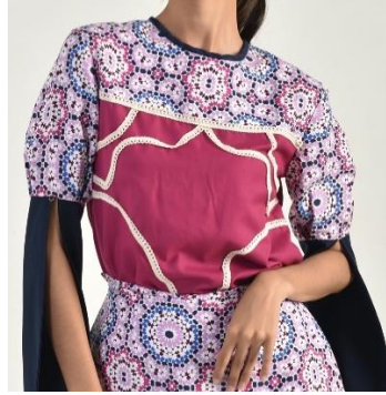
Gambar 12. Renda katun.

Koleksi busana ini memiliki 2 motif, yaitu motif flora. Motif flora yang terinspirasi dari bunga dan elemen alam dari gaya busana hippie . Motif flora hippie memiliki ciri khas dengan gambar-gambar bunga, daun, matahari yang menggambarkan semangat alami, kebebasan, dan kedamaian yang menjadi ciri khas gerakan hippie . Motif-motif ini menampilkan gambar bunga dengan warna yang terang dan ukuran yang besar.