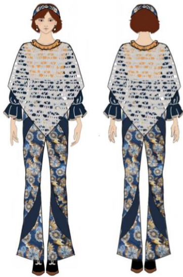
Gambar 21. Ilustrasi ready to wear 1.