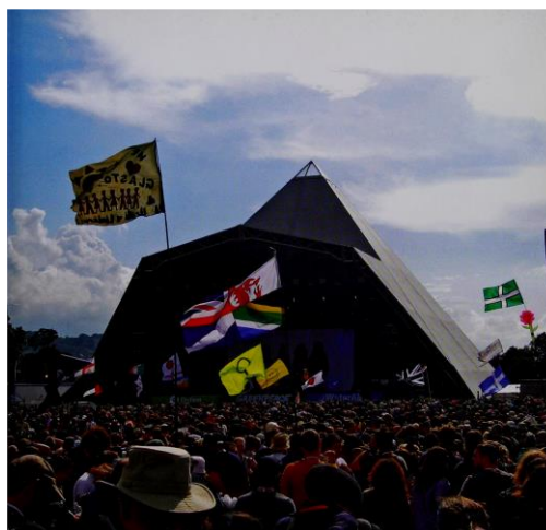
Gambar 1. Festival musik di Inggris. (Bailey, 2013: 113)

Festival yang terbentuk pada saat yang sama dengan gerakan hippie dan telah terkait erat dengan nilai-nilai sosial dan politik ini telah memenangkan Festival Award dalam Rolling Stone UK Awards 2022. Sampai saat ini festival Glastonbury masih diadakan selama lima hari setiap tahunnya. Disediakan tempat camping untuk pengunjung yang ingin menginap selama festival berlangsung.