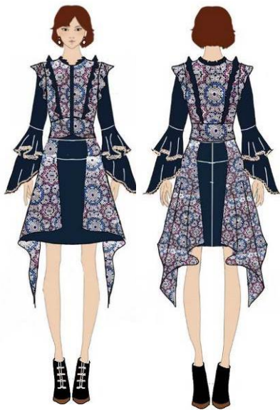
Gambar 27. Ilustrasi ready to wear 4.