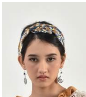
Gambar 16. Headband motif.