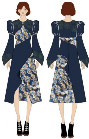
Gambar 31. Ilustrasi art wear 2.

Koleksi art wear yang kedua memiliki garis siluet X-Line . Look ini terdapat 2 pieces yaitu, dress dan bolero. Bagian yang pertama yaitu bolero dengan bahan katun berwarna biru tua. Bolero ini memiliki ukuran crop sepanjang 28 cm yang diikombinasikan dengan lengan panjang model puff di bagian atas lengan. Panjang lengan memiliki ukuran sepanjang 68 cm. Lengan ini memiliki model terompot yang dibuat segitiga pada bagian tepi lengan. Opener pada bolero ini terdapat di bagian depan menggunakan satu kancing. Terdapat detil sashiko pada bagian muka, belakang, dan tepi lengan. Sashiko yang diaplikasikan menggunakan benang sulam berbahan katun berwarna kuning. Dress ini menggunakan bahan katun berwarna biru tua yang dikombinasikan dengan katun motif bunga. Dress ini memiliki panjang 128 cm dengan variasi bentuk rok A-Line . Terdapat belahan bentuk A-Simetris pada bagian depan dress . Menggunakan opener zipper sepanjang 60 cm. Detil pada dress ini terdapat pada bagian layer biru tua yaitu dengan hiasan sashiko . Detil ini menggunakan benang sulam berbahan katun berwarna kuning.