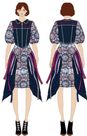
Gambar 29. Ilustrasi art wear 1.

Koleksi art wear yang pertama memiliki garis siluet X-Line dan terdiri dari 2 pieces . Pada pieces yang pertama yaitu blouse menggunakan kain katun dengan warna biru tua yang dikombinasikan pada bagian lengan dengan menggunakan katun motif bunga geometris. Blouse ini memiliki ukuran panjang 40 cm dan panjang lengan 38 cm. Model lengan pada look ini yaitu lengan balon dengan sedikit kerutan di bagian bawah lengan. Opener pada blouse ini terdapat di bagian muka dengan zipper panjang 38 cm. Bagian selanjutnya terdapat rok dengan siluet A-Line yang menggunakan bahan katun berwarna biru tua yang dikombinasikan dengan katun motif bunga geometris. Panjang rok ini yaitu 60 cm dan untuk layer luar memiliki ukuran 85 cm. Opener rok ini menggunakan invisible zipper yang terdapat pada bagian belakang dengan panjang 25 cm. Terdapat tali-tali dengan warna maroon , light pink , dan biru sebagai tambahan detil pada rok. Detil utama pada koleksi ini yaitu teknik sashiko yang diterapkan pada bagian depan dan belakang blus. Sashiko dikerjakan dengan menggunakan benang sulam yang memiliki serat katun. Warna benang sulam yang dipakai yaitu warna light pink . Diaplikasikan pada blouse bagian muka, belakang, dan juga pada rok layer warna biru tua