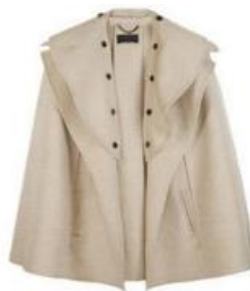
Gambar 8. Cape . (Putri, 2014: 13)

Cape adalah pakaian luar yang longgar berbentuk jubah tanpa lengan yang biasanya digunakan untuk menutupi lengan. Biasanya bagian yang terpisah dari pakaian, digunting lingkaran atau setengah lingkaran.