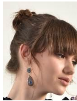
Gambar 19. Anting.