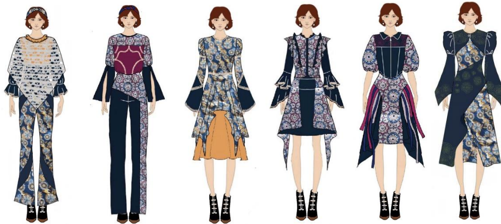
Gambar 20. Ilustrasi desain busana ready to wear dan art wear

Realisasi desain terdapat dua jenis busana, yaitu busana ready to wear dan busana art wear . Koleksi ini terinspirasi dari kemeriahan festival musik Glastonbury yang terdiri dari 4 busana ready to wear dan 2 busana art wear dengan gaya casual dan tampilan festival chic . Koleksi ini terdiri atas blouse , bell bottom , dress , dan cape . Warna-warna yang digunakan pada koleksi ini disesuaikan dengan warna kolase tema atau moodboard . Warna yang diterapkan yaitu maroon , light pink , off-white , khaki , biru, biru tua, dan kuning tua.