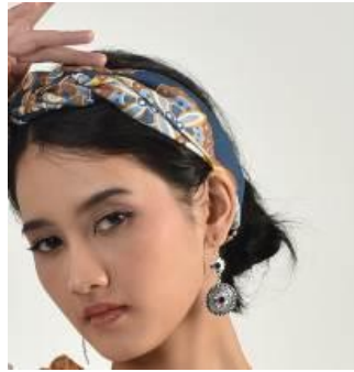
Gambar 18. Anting bulat.