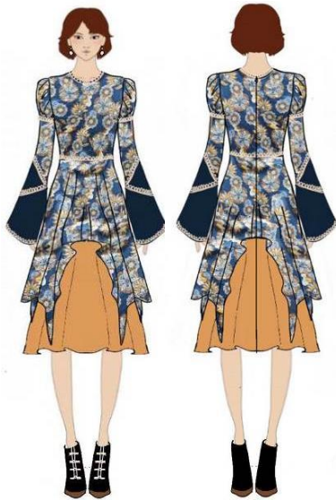
Gambar 25. Ilustrasi ready to wear 3.

biru tua dan kuning tua. Memiliki panjang lengan dengan keseluruhan ukuran 68 cm. Sedangkan kain biru tua polos memiliki panjang 27 cm. Mengenai dress memiliki panjang ukuran sampai lutut yaitu 115 cm. Panjang rok kuning tua memiliki ukuran sepanjang 72 cm. Bawah layer rok berwarna kuning tua memiliki bentuk pola circle . Keseluruhan lingkaran rok memiliki ukuran 256 cm. Rok kuning tua menggunakan lining dengan jenis super lining . Tambahan sentuhan detil-detil renda rajut berbahan dasar katun ditempatkan pada bagian leher, lengan, dan pinggang. Opener pada look yang ketiga ini menggunakan invisible zipper di bagian belakang dress dengan panjang 65 cm.