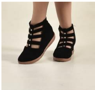
Gambar 15. Boots .

Aksesoris yang digunakan pada koleksi rancangan busana ini berupa headband dan boots yang sesuai dengan konsep. Pemilihan headband yang digunakan yaitu terbuat dari katun polos dan motif. Headband menjadi bagian ikonik dari mode dan ekspresi diri para hippie . Sedangkan boots yang digunakan memiliki tinggi 3 centimeter dan warna boots yang dipakai menggunakan warna hitam dengan opener dengan invisible zipper di sisi.