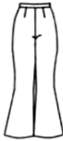
Gambar 6. Bell bottom . (Koester,1991: 42)

Pada awalnya terinspirasi dari celana pelaut ( sailor ) dan kini sangat populer untuk dikenakan oleh pria dan wanita.