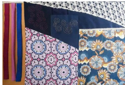
Gambar 10. Kolase bahan

Koleksi busana ini menggunakan pengaplikasian detil dengan renda katun dan hiasan dengan teknik sashiko . Sashiko yaitu teknik jahit hias yang memiliki tusukan-tusukan kecil. Teknik hiasan ini berasal dari Jepang. Sashiko menggunakan jahitan jelujur pada pengaplikasian motif pada koleksi busana ini. Proses penerapan sashiko ke dalam busana menggunakan jahitan tangan secara langsung, sehingga sashiko termasuk jenis teknik handcrafting . Menggunakan benang sulam berbahan katun dan memiliki ketebalan yang konsisten. Penggunaan detil teknik