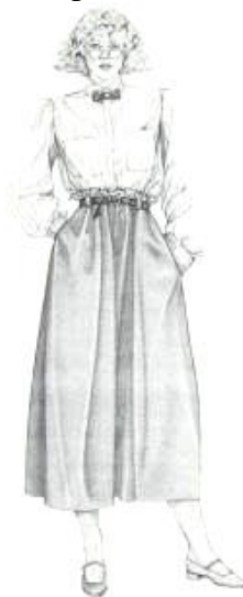
Gambar 3. Gaya busana casual. (Cho, 1986: 96)

Pakaian casual populer pada tahun 1980-an dan dikenal dengan produk mode yang berfungsi sebagai busana untuk beraktivitas sehari-hari. Seperti jacket , cardigan , sweater , t-shirt , cargo pants , jumpsuits , dll. Sweater yang berukuran besar dan kemeja yang manis untuk musim yang dingin dan dengan t-shirt untuk musim panas.