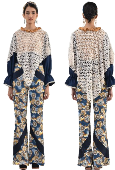
Gambar 22. Busana siap pakai 1.

Koleksi busana siap pakai yang kedua terdapat 2 pieces yaitu blouse dan pants . Blouse longgar ini menggunakan bahan wool blend polos berwarna maroon dipadukan dengan katun bermotif bunga geometris. Blouse ini menggunakan lengan lonceng yang diberi variasi pada belahan lengan dan dipadukan dengan lipit di bagian lengan. Lengan ini memiliki ukuran sepanjang 65 cm. Detil pada blouse ini yaitu renda rajut yang diaplikasikan pada bagian depan dan belakang blouse . Selain itu juga terdapat garis hias yoke , yaitu garis hias yang letaknya berada di atas dada. Opener blouse ini terdapat pada bagian belakang dengan menggunakan invisible zipper panjang 25 cm. Pada bagian celana memakai bahan corduroy warna biru tua yang dipadukan dengan kain katun motif bunga geometris. Terdapat peplum dengan kain motif di bagian depan dan belakang panggul. Opener celana ini terdapat pada bagian samping dengan menggunakan invisible zipper . Pada look ini menggunakan aksesoris headband dari kain katun yang memiliki warna maroon dan biru.