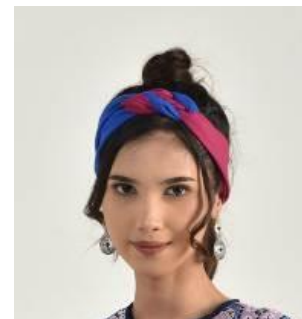
Gambar 17. Headband .