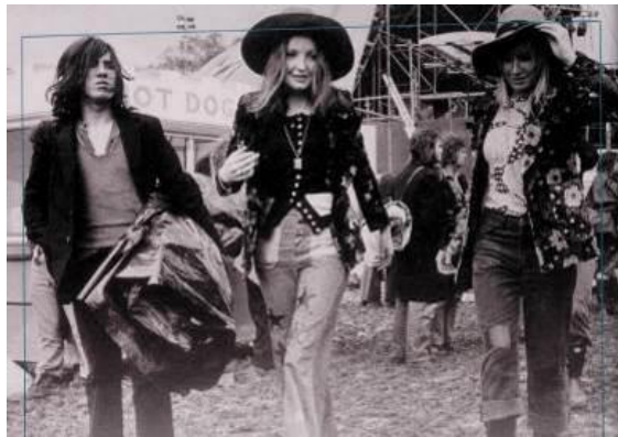
Gambar 2. Gaya busana festival chic . (Sonneborn, 2014: 34)

Sekitar akhir tahun 1960an menjadi awal mula berkembangnya gaya festival chic . Tampilan festival chic sering mencampurkan gaya hippie dan gaya bohemian yang tetap menjadi busana untuk musim panas. Gaya tampilan ini populer di festival musik dan acara budaya dengan menampilkan ekspresi pribadi dan gaya yang mencolok. Gaya ini ditandai dengan pakaian casual seperti atasan crop , blus longgar, pakaian lapisan seperti outer panjang, jaket rajut, hot pants , dan bell bottom . Menggunakan motif bunga-bunga, tie-dye , psikedelik.