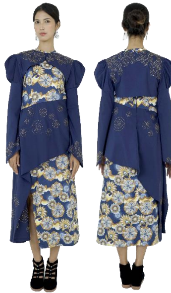
Gambar 32. Busana seni 2.