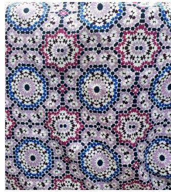
Gambar 14. Floral geometris

Aksesoris yang digunakan pada koleksi rancangan busana ini berupa headband dan boots yang sesuai dengan konsep. Pemilihan headband yang digunakan yaitu terbuat dari katun polos dan motif. Headband menjadi bagian ikonik dari mode dan ekspresi diri para hippie . Sedangkan boots yang digunakan memiliki tinggi 3 centimeter dan warna boots yang dipakai menggunakan warna hitam dengan opener dengan invisible zipper di sisi.