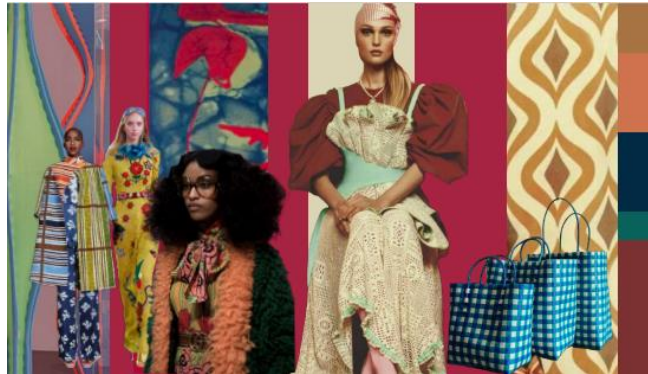
Gambar 4. The Survivors, Retro, Fashion Trend 2023/2024 Co-Exist . (Midiani, 2022: 28)

Koleksi busana mengacu pada The Survivors, Retro, Fashion Trend 2023/2024 Co-Exist . Nuansa vintage dengan baju-baju lama tahun 70s-80s dijadikan inspirasi dengan sentuhan baru dan kekinian. Bentuk dan tampilan yang baru dengan nuansa vintage yang kental. Motif-motif big pattern seperti kembang-kembang atau motif abstrak.