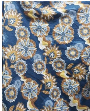
Gambar 13. Floral.

Koleksi busana ini memiliki 2 motif, yaitu motif flora. Motif flora yang terinspirasi dari bunga dan elemen alam dari gaya busana hippie . Motif flora hippie memiliki ciri khas dengan gambar-gambar bunga, daun, matahari yang menggambarkan semangat alami, kebebasan, dan kedamaian yang menjadi ciri khas gerakan hippie . Motif-motif ini menampilkan gambar bunga dengan warna yang terang dan ukuran yang besar.