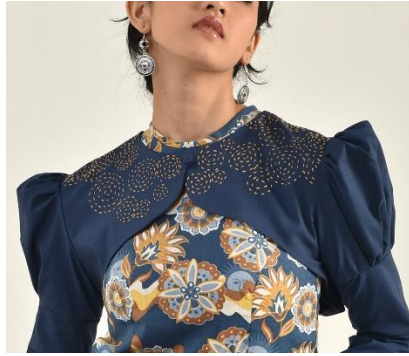
Gambar 11. Sashiko .

sashiko diterapkan pada koleksi busana ini yaitu di bagian blouse dan rok.