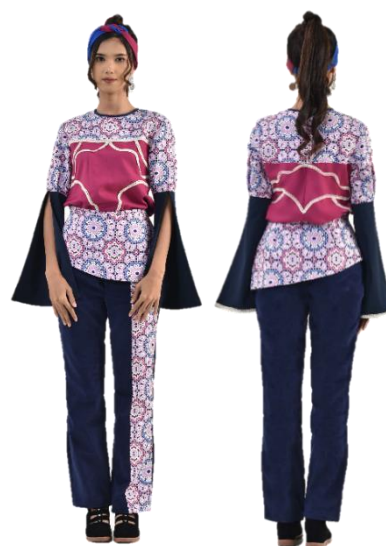
Gambar 24. Busana siap pakai 2.

Koleksi siap pakai yang ketiga terdiri dari 1 piece yaitu dress dengan bawah layer . Menampilkan siluet A-Line yang mengecil di bagian pinggang, lalu melebar di bagian bawah rok. Dress ini menggunakan bahan katun motif bunga dengan kombinasi katun polos berwarna