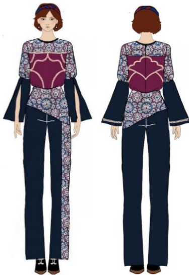
Gambar 23. Ilustrasi ready to wear 2.

Koleksi busana siap pakai yang kedua terdapat 2 pieces yaitu blouse dan pants . Blouse longgar ini menggunakan bahan wool blend polos berwarna maroon dipadukan dengan katun bermotif bunga geometris. Blouse ini menggunakan lengan lonceng yang diberi variasi pada belahan lengan dan dipadukan dengan lipit di bagian lengan. Lengan ini memiliki ukuran sepanjang 65 cm. Detil pada blouse ini yaitu renda rajut yang diaplikasikan pada bagian depan dan belakang blouse . Selain itu juga terdapat garis hias yoke , yaitu garis hias yang letaknya berada di atas dada. Opener blouse ini terdapat pada bagian belakang dengan menggunakan invisible zipper panjang 25 cm. Pada bagian celana memakai bahan corduroy warna biru tua yang dipadukan dengan kain katun motif bunga geometris. Terdapat peplum dengan kain motif di bagian depan dan belakang panggul. Opener celana ini terdapat pada bagian samping dengan menggunakan invisible zipper . Pada look ini menggunakan aksesoris headband dari kain katun yang memiliki warna maroon dan biru.