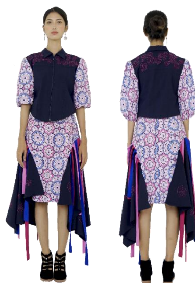
Gambar 30. Busana seni 1.