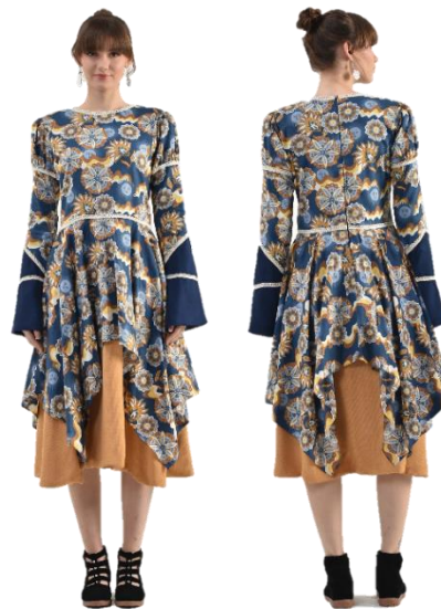
Gambar 26. Busana siap pakai 3.

Koleksi busana siap pakai yang keempat terdapat 2 bagian yaitu blouse dan rok A-Line . Blouse ini menggunakan bahan katun motif floral geometris yang dipadukan dengan wool blend dengan warna biru tua. Menggunakan opener pada bagian depan dengan kancing yang terdapat lima buah. Memiliki lengan licin dengan pengulangan ruffle di bawah lengan. Panjang lengan yang direalisasikan yaitu memiliki ukuran 68 cm. Sedangkan panjang blouse memiliki ukuran 34 cm. Detil pada blouse ini yaitu renda rajut yang diletakkan pada sekeliling tepi lengan blouse . Piece kedua yaitu rok yang memiliki siluet A-Line . Bahan yang digunakan yaitu wool blend dengan katun motif floral geometris. Panjang rok biru tua yaitu 60 cm dan layer roknya memiliki panjang 85 cm. Mengenai opener terdapat pada bagian belakang rok menggunakan invisible zipper sepanjang 25 cm.