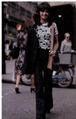
Gambar 5. Gaya busana santai. (Sonneborn, 2014: 36)

Busana yang sederhana, praktis, nyaman dipakai, dan longgar merupakan karakteristik dari busana santai. Dikenakan dalam waktu santai atau semi formal dalam kehidupan sehari-hari yang disesuaikan dengan kegiatan apa saja yang akan dilakukan. Busana santai lebih mengutamakan kenyamanan dan ekspresi diri dengan model busana yang sederhana namun tetap menarik. Bahan yang digunakan yaitu bahan yang nyaman dipakai dan menyerap keringat. Seperti bahan yang terbuat dari serat alami yaitu katun.