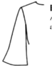
Gambar 7. Lengan lonceng. (Koester,1991: 14)

Lengan lonceng yaitu bentuk pengembangan dari lengan licin yang bagian bawahnya mengembang atau membesar. Pengertian lain yaitu lengan baju yang standar yang bersuar keluar yang berbentuk seperti bel atau lonceng. Jenis lengan ini banyak dijumpai pada busana santai.