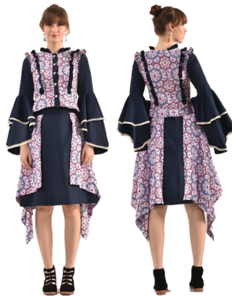
Gambar 28. Busana siap pakai 4.

Koleksi art wear yang pertama memiliki garis siluet X-Line dan terdiri dari 2 pieces . Pada pieces yang pertama yaitu blouse menggunakan kain katun dengan warna biru tua yang dikombinasikan pada bagian lengan dengan menggunakan katun motif bunga geometris. Blouse ini memiliki ukuran panjang 40 cm dan panjang lengan 38 cm. Model lengan pada look ini yaitu lengan balon dengan sedikit kerutan di bagian bawah lengan. Opener pada blouse ini terdapat di bagian muka dengan zipper panjang 38 cm. Bagian selanjutnya terdapat rok dengan siluet A-Line yang menggunakan bahan katun berwarna biru tua yang dikombinasikan dengan katun motif bunga geometris. Panjang rok ini yaitu 60 cm dan untuk layer luar memiliki ukuran 85 cm. Opener rok ini menggunakan invisible zipper yang terdapat pada bagian belakang dengan panjang 25 cm. Terdapat tali-tali dengan warna maroon , light pink , dan biru sebagai tambahan detil pada rok. Detil utama pada koleksi ini yaitu teknik sashiko yang diterapkan pada bagian depan dan belakang blus. Sashiko dikerjakan dengan menggunakan benang sulam yang memiliki serat katun. Warna benang sulam yang dipakai yaitu warna light pink . Diaplikasikan pada blouse bagian muka, belakang, dan juga pada rok layer warna biru tua