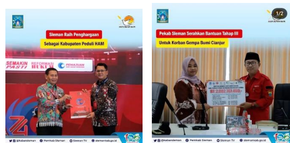
Gambar 1. Konten informatif

Pada konten informatif telah terpilih 2 sampel konten berdasarkan konsep visual dan jumlah likes serta commentsnya dengan rincian sebagai berikut :