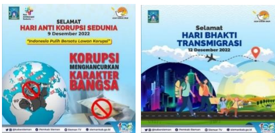
Gambar 3 emosional

Pada konten emosional telah terpilih 1 jenis sampel konten berdasarkan konsep visual dan jumlah likes serta commentsnya dengan rincian sebagai berikut: