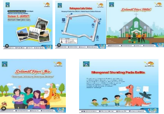
Gambar 4 emosional